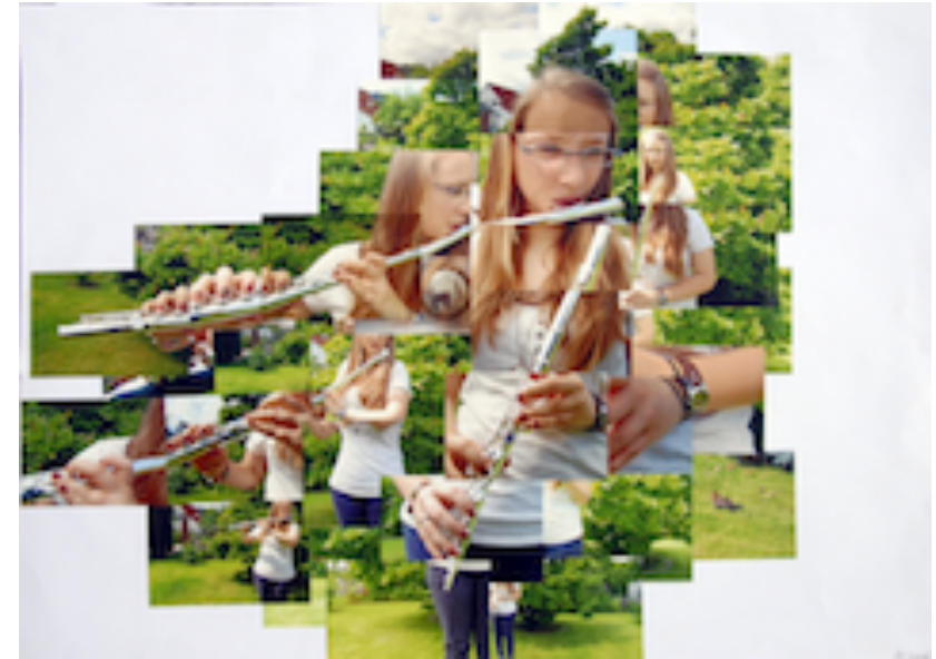
Jgst. EF / Q1