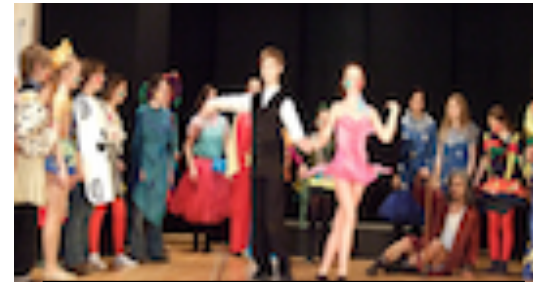
A Christmas Carol 2007