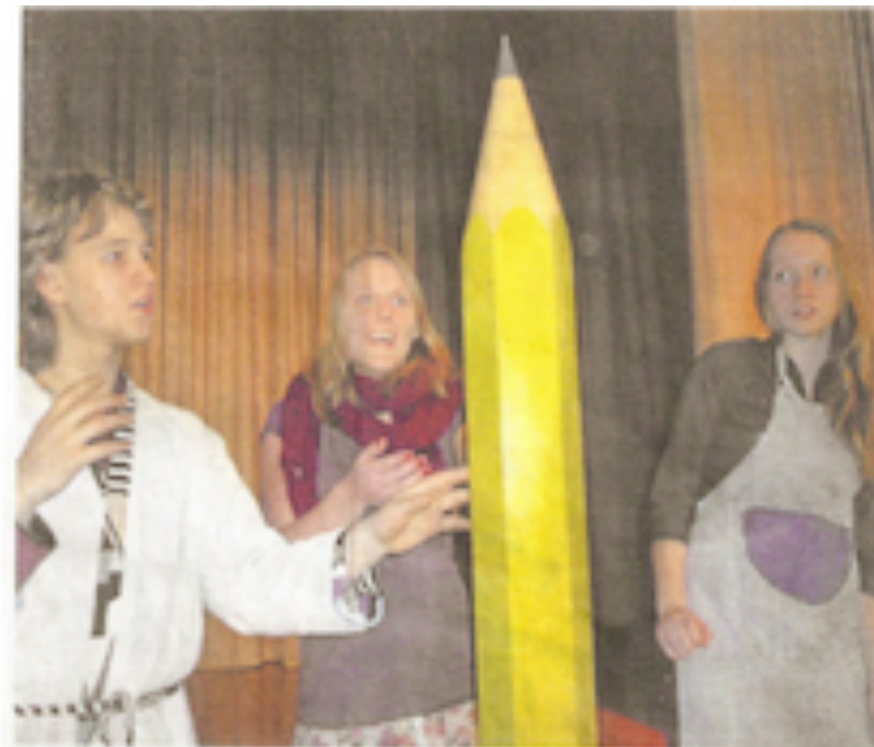
Die Theater AG der Hildegardis-Schule ist jetzt für ihre Produktion „Palace“ ausgezeichnet worden.