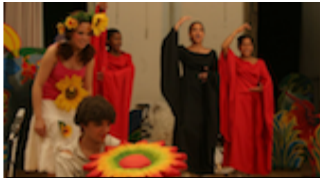
Das Geheimnis der Karten 2004