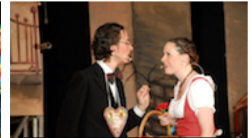
Im Weißen Rössl 2008